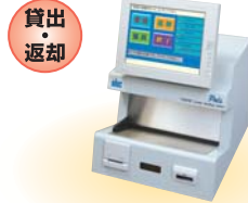
図書館自動貸出・返却システム