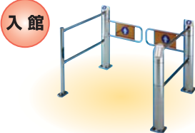
図書館入館管理システム