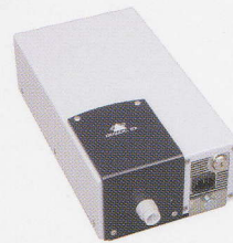
コントロールボックス DLC-EPQ

クリスタル感覚のクリアなデザインで開放感はそのままに、来館者に威圧感を与えず不正持ち出しを未然にガード。