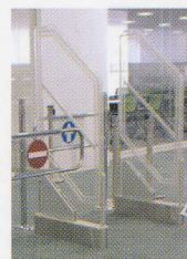
◀ゲートスタンド (オプション) ご希望の高さにサイズアップ