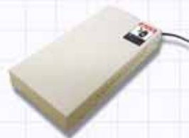
電源ボックス (本体付属品) サイズ: 124.5(W), 266.8mm(D), 45mm(H)